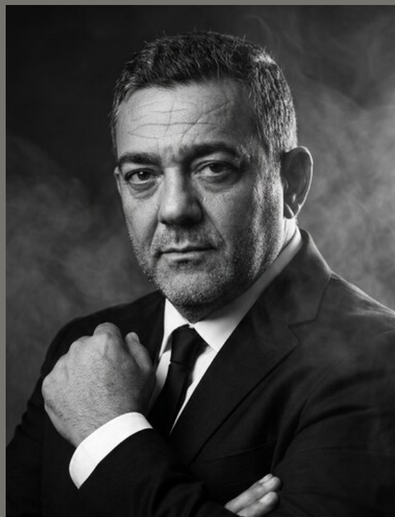
Immagine generata artificialmente grazie all'intelligenza artificiale.

Presidente e Fondatore della Zygomatic Implants World Academy.